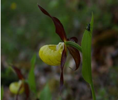
Sabot de venus

Très belle randonnée qui chemine la plupart du temps sur un sentier protégé des rayons solaires par une imposante forêt de hêtres. Au départ de Gigors ou de l'embranchement de la piste de l'hubac située 500m plus haut que le village, poursuivre la piste jusqu'à sa barrière. Prendre à droite le sentier qui, après avoir à nouveau traversé la piste va vous conduire jusqu'au refuge du Jas et sa rafraîchissante source. Sous le refuge, un nouveau sentier démarre pour atteindre en peu de temps une nouvelle piste que vous allez emprunter par sa gauche. Au bout de celle-ci remonter légèrement sur une trace de coupe puis prendre à gauche un nouveau sentier. Attention, sur cette portion quelques passages délicats sont facilités par la présence de mains courantes. Prudence de rigueur . Vous arrivez enfin à proximité de votre point culminant, la Tête de la Plane, superbe panorama sur la plaine de Turriers. Reprendre le sentier en direction de Gigors par la Dent. Arriver au niveau de celle-ci, bifurquer à droite. 5mn plus tard, un croisement de sentier vous oblige à choisir : soit descendre directement sur Gigors ( plus sympa ), soit rejoindre la D951 par la piste, à vous de choisir !